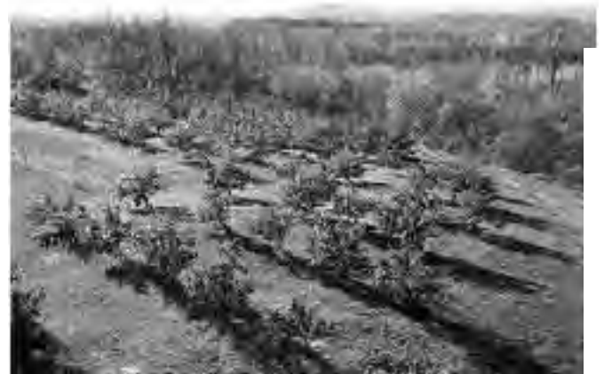
Une pommeraie de Saint-Joseph-du-Lac

La SHRDM sera l'hôte d'un important événement soit le 42e congrès de la Fédération des Sociétés d'histoire du Québec. Le congrès se tiendra dans la région des Laurentides, à l'Hôtel Mont-Gabriel de Sainte-Adèle, du 25 au 27 mai 2007. Le thème de ce congrès portera sur la place et l'importance des paysages dans l'histoire et le développement des Laurentides. Les congressistes seront alors accueillis par la Table des sociétés d'histoire des Laurentides chapeauté par le Conseil de la culture des Laurentides qui regroupe plus de 18 organismes en histoire et en patrimoine de la région. Pensez-donc à réserver cette fin de semaine qui vous permettra d'en apprendre plus sur l'histoire de la grande région des Laurentides tout en y faisant des rencontres fort intéressantes !