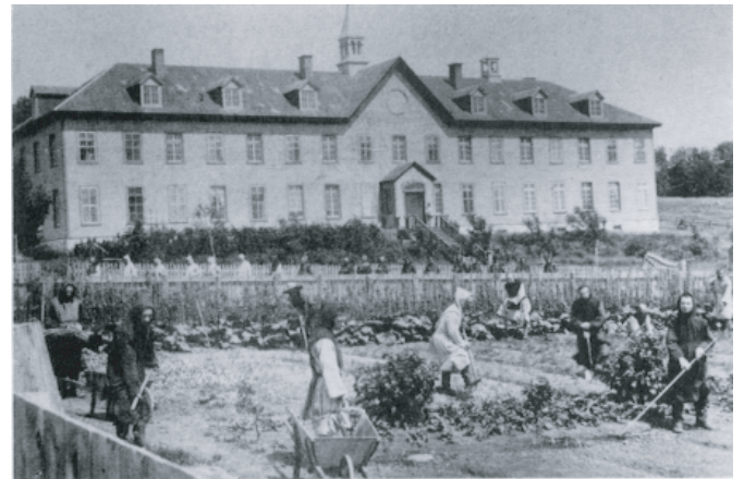
Les moines trappistes à Oka.